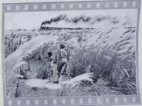
অশুভিষ্টি রায়ের 'অসংখ্য' চলচ্চিত্রের একটি দৃশ্য