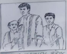
অশুভিষ্টি রায়ের 'অসংখ্য' চলচ্চিত্রের একটি দৃশ্য